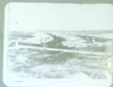
Посёлок в 1960 г